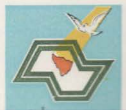
EDGARD ALEXANDRE PREFEITO

Prefeitura Municipal de Embaúba, 05 de novembro de 1996.